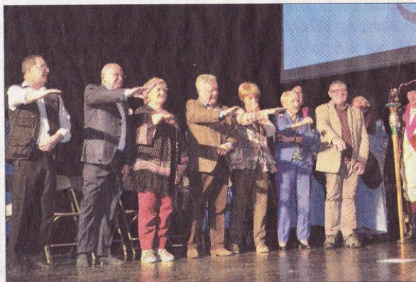
■ Les impétrants ont été intronisés après avoir juré fidélité au petit pâté.