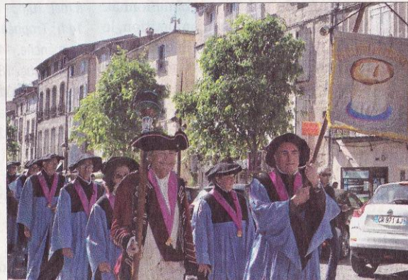
■ Le défilé réalisé en centre-ville a été très remarqué des passants.