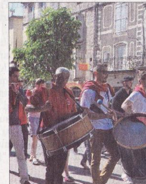
■ La musique des Fadas a animé le défilé avec ardeur.